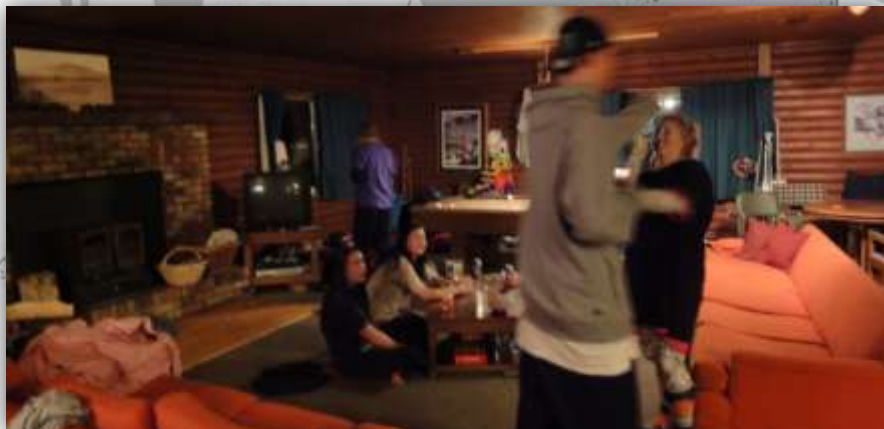
der wohnraum mit laufenden partyspielen