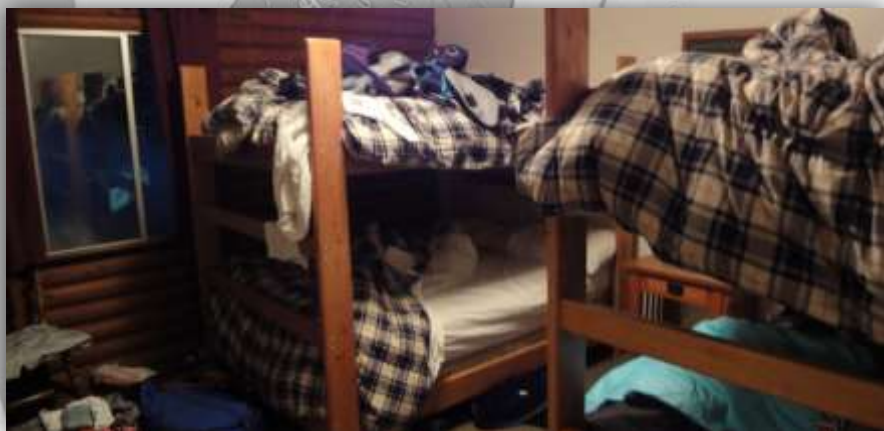
das verwüstete schlafzimmer nach einer harten nacht

Déjà-vu dank der selben Situation – Freshman Girls die sich total besaufen.