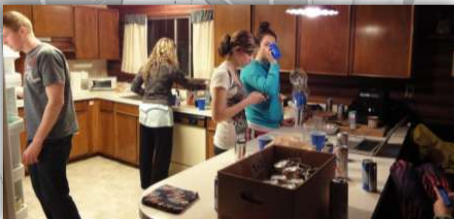
die küche mit reichlich alkohol in der box