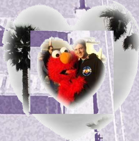
Auf dem Weg nach San Diego - ein erster Stop am Strand.