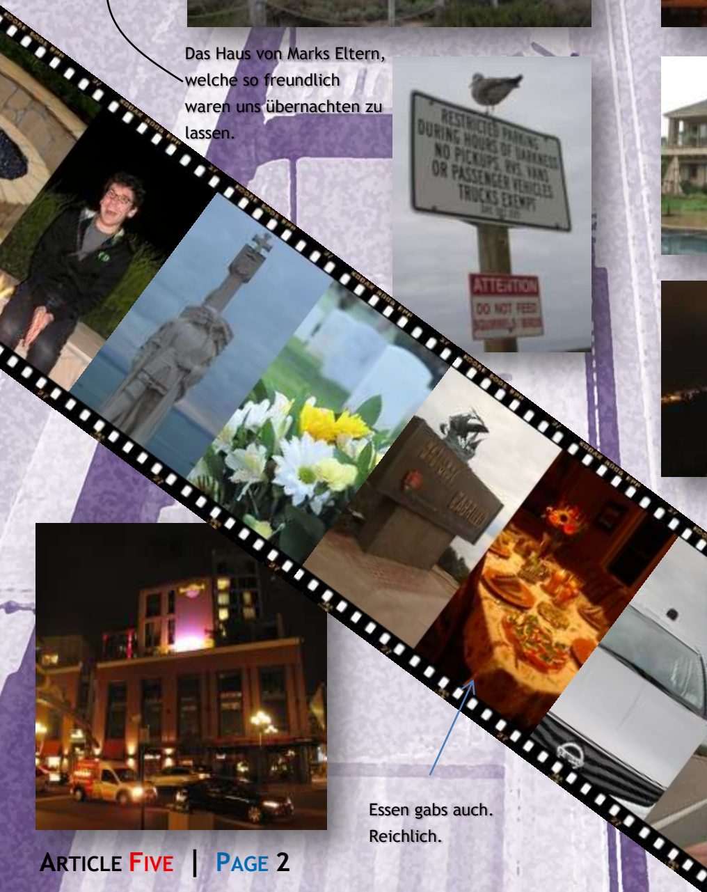
Essen gabs auch. Reichlich.