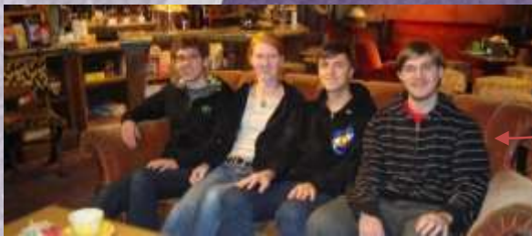
Das ist die Couch aus der Fernsehserie Friends.