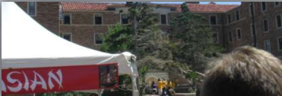
vor der ferrand hall bei einem asiatischen essenstand