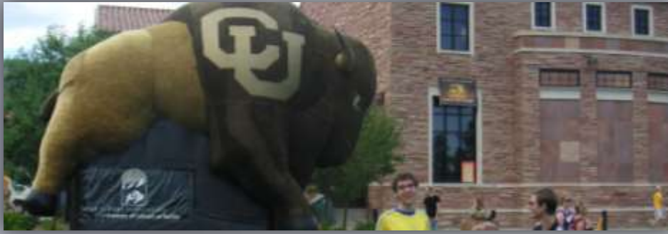
beim global jam auf dem ferrand field