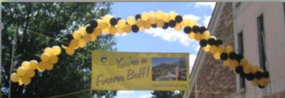
wie alle freshmen sind wir durch den balloon arch gegangen